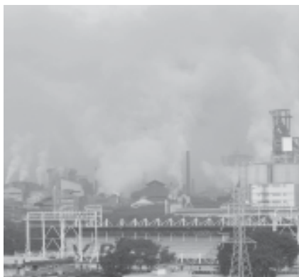
Alvo de reclamações da população, CSN é multada em R$ 3 milhões

Para fechar o mês de maio cinzento para os lados da empresa de propriedade do empresário Benjamin Steinbruch, na terça-feira (dia 27), a Delegacia de Proteção ao Meio Ambiente (DPMA) realizou uma vistoria no interior da Usina Presidente Vargas (UPV). A informação foi confirmada pela assessoria de imprensa da Polícia Civil.