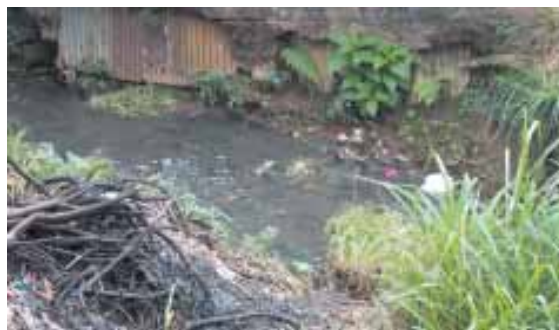
Corrego dos Carvalhos exala mau cheiro e causa doença nos moradores