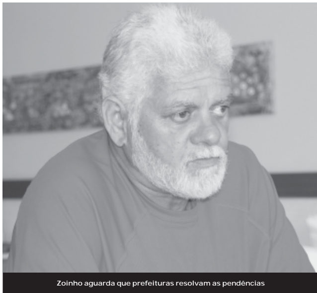
Zoinho aguarda que prefeituras resolvam as pendências

As emendas individuais dos deputados federais garantem recursos para as prefeituras realizarem obras importantes para a população. No entanto, o descumprimento de prazos e a falta de atenção com trâmites para a liberação dessas verbas têm levado diversas cidades a perderem os repasses do governo federal. Na região Sul do estado e na Costa Verde três municípios perigam ficar sem esses recursos caso não apresentem a documentação completa até a próxima quarta-feira (dia 4): Volta Redonda, Vassouras e Angra dos Reis.