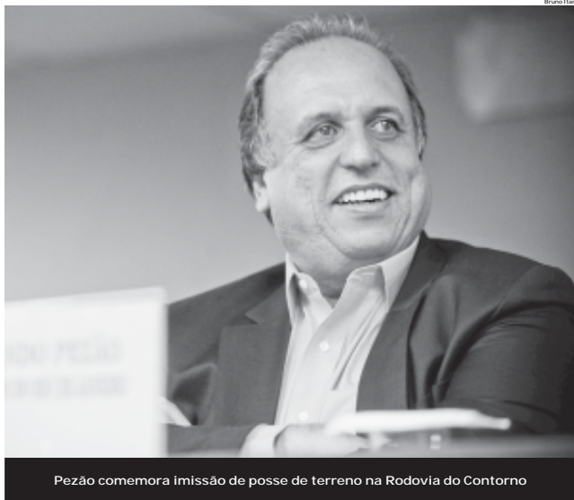
Pezão comemora imissão de posse de terreno na Rodovia do Contorno

Esperada pela população há mais de 19 anos, a Rodovia do Contorno terá 13,5 quilômetros, ligando a Via Dutra (BR-116 Sul) com a Rodovia Lúcio Meira (BR-393), formando um corredor de tráfego de carga pesada entre o Sul e o Norte/Nordeste do país. Estão sendo construídas as interseções com a Ro-