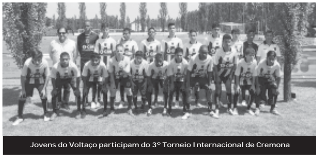
Jovens do Voltaço participam do 3º Torneio Internacional de Cremona

O 3º Torneio Internacional de Cremona acontece entre os dias 30 de maio e 1º de junho, na cidade de Cremona, na Itália. A competição, destinada a garotos nascidos entre os anos 2000 e 2001, conta com a participação de grandes clubes do cenário esportivo mundial, como Juventus, Inter de Milão, Parma e Atlético de Madrid. É a primeira experiência internacional do Voltaço, único representante brasileiro no torneio.