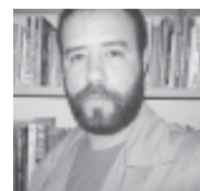
Por Adelson Vidal Alves

Granato afirmou que o bate-papo com Neto foi bastante proveitoso, e adiantou que foi a primeira de muitas. O parlamentar contou ainda que o chefe do Executivo de Volta Redonda se mostrou disposto a escutar as reivindicações das partes envolvidas. Sobre as mudanças na Feira Livre, o presidente da Câmara disse que ser a favor do horário de funcionamento, alterado recentemente. Segundo ele, "não é justo que os moradores dos bairros, que recebem a feira, sejam prejudicados com a demora na desmontagem das barracas".