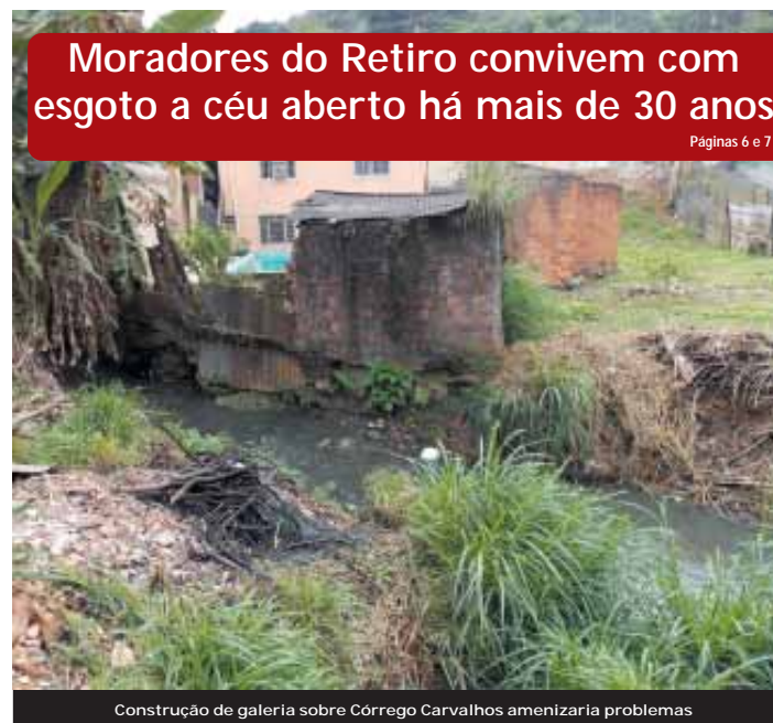
Construção de galeria sobre Córrego Carvalhos amenizaria problemas