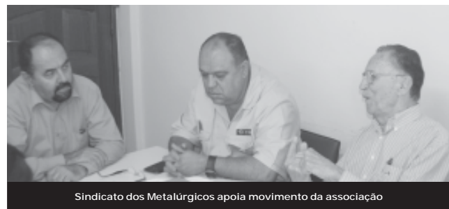
Sindicato dos Metalúrgicos apoia movimento da associação