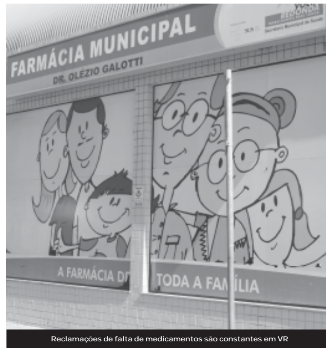
Reclamações de falta de medicamentos são constantes em VR

Amoxicilina faz parte de uma cesta básica de medicamentos e por isso, teoricamente, não poderia faltar nas prateleiras das unidades de saúde, muito menos na Farmácia Municipal. Mas, o drama em busca por medicamentos básicos vai além de um simples antibiótico infantil e atinge também os antidiabéticos, medicamentos para tratamentos e controle da diabetes. A Metformina é um medicamento oral que consta da lista de medicamentos essenciais